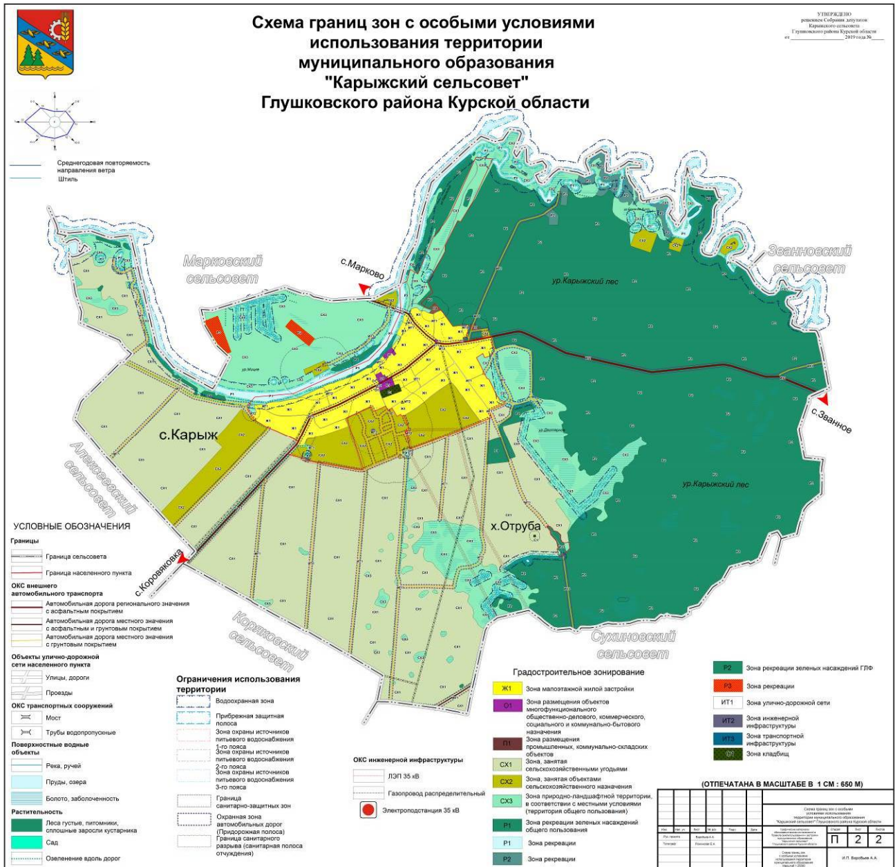
Рис.2. Схема границ зон с особыми условиями использования территории муниципального образования «Карыжский сельсовет» Глушковского района Курской области